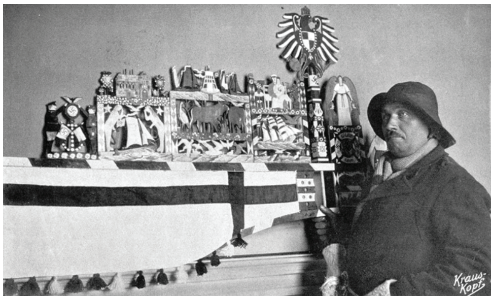
5 pav. Žvejys, pozuojantis su suvenyrine vėtrunge Fig. 5. Fisherman posing with a souvenir weathervane

Šie verslai paveikė ir vietinių žvejų charakterį. Štai kaip XIX a. pab. apie juos atsiliepė vienas žurnalistas: „Šiaip jie yra nepaprastai taupūs, kone šykštūs, gudriai apskaičiuoja, o nuo to laiko, kai pradėjo važiuoti į juos vasarotojai, įprato vertinti pinigais kiekvieną paslaugą ir prašyti pernelyg aukštų kainų už savo produktus“ (Strakauskaitė, 2001, p. 68).