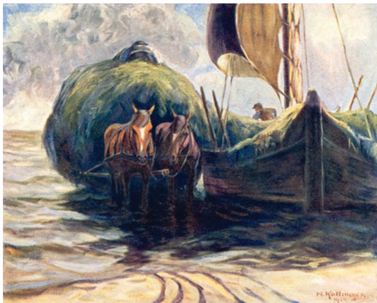
4 pav. Žvejybinė valtis su kraunamu šienu Kuršių nerijoje. Dailininkas H. Kallmeyer Fig. 4. Fishing sailboat with hay being loaded in the Curonian Spit. By H. Kallmeyer

Smuklių ir pašto stočių laikytojai taip pat turėjo teisę verstis žvejyba. Pavyzdžiui, smuklės savininkui Rusnėje 1498 m. suteikta teisė žvejoti mariose apskritus metus ir pardavinėti laimikį aukščiausia kaina (Demereckas, Servienė, 1998). 1519 m. Karvaičių smuklininkui Benediktui Langfeldui suteikta teisė žvejoti mariose ir jūroje, „kiek jis pajėgs viena valktimi ištraukti, išskyrus ungurių gaudymą su nurodytomis priemonėmis“ (Baranauskas, 1999, p. 13). Nors žvejyba tokiems verslininkams būdavo antraeilis užsiėmimas, tačiau ir ji duodavo pelno: dalį pagautos žuvies smuklininkai sunaudodavo pagrindiniame savo versle – maitindavo smuklėje apsistojančius keliautojus. Tai turėjo būti pelninga verslo šaka, nes pinigai, sumokėti už leidimą žvejoti, sugrįždavo aptarnaujant klientus (nepaisant pajamų, gaunamų už kitą maistą [ne žuvį] ir gėrimus, nakvynę, žirgų ir ekipažų priežiūrą ir kt.). Pasitaikydavo atvejų, kai oficialiai vienam asmeniui būdavo suteikiama teisė verstis net trimis veiklomis: 1660 m. Prūsijos didysis kunigaikštis vienam Karklės kaimo gyventojui padovanojo žemės, leido gaminti alų ir žvejoti (Lemke, 1966). XIX a. smuklių verslas nunyko, tačiau atsirado nauja, panaši verslo rūšis, susijusi su vis populiarėjančia kurortų tradicija – viešbučių ir viešojo maitinimo įstaigų veikla (žr. toliau).