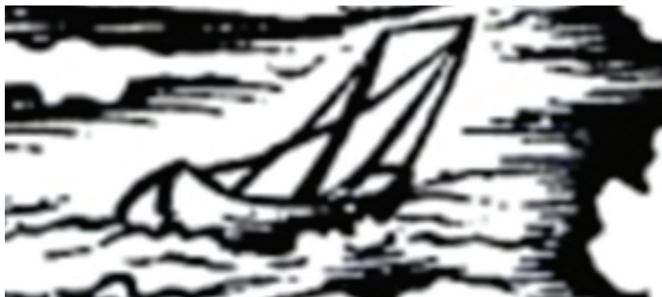
1 pav. Vienas ankstyviausių žvejų burvaltės Kuršių mariose atvaizdų (H. Zello 1542 m. žemėlapių fragmentas).

Fig. 1. One of the earliest images of a fishing sailboat in the Curonian Lagoon (fragment of a map by H. Zell, 1542)