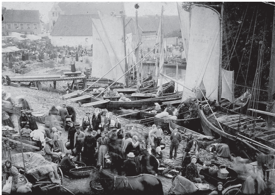
3 pav. Žuvų turgus Šilutėje Fig. 3. Fish market in Šilutė

trojo pasaulinio karo metais turgus veikdavo ketvirtadieniais (Cyrulis, 2015). Šie turgūs skyrėsi nuo žemyninių turgų. Tokią arskirtį daryti galima, kai norima pabrėžti skirtumus tarp žemyninės ir jūrinės kultūrų. Tipiškas pamario žuvų turgaus vaizdas buvo palei krantą išsirikiavusios daugiausia Kuršių nerijos žvejų valtytis, tiesiai iš kurių ir prekiauta žuvimi. Žuvį pardavinėdavo ir patys žvejai, ir žuvų supirkėjai-perpardavinėtojai. Žinoma, tokiuose turguose prekiauta ne tik žuvimi. Už uždirbtus pinigus žvejai pirkdavosi tai, ko nebuvo Kuršių nerijoje: maistą, grūdus, virves, kitus daiktus, kurių prirėdavo buityje, žvejyboje ar laivyboje. Svarbu tai, kad turgų aikštės veikė šių gyvenviečių urbanistinę raidą – gatvių ir kvartalų formavimąsi, užstatymus ir pan. Puikus šio reiškinių pavyzdys – senoji Šilutės miesto dalis, kurioje yra ir senojo turgaus aikštė, prisišliejusi prie Šyšos upės – ją turgų atplaukdavo žvejai, kranto. Aplink turgaus aikštę galima pamatyti tokius gatvių užrašus: Uosto, Vandens, Žuvų, Turgaus, Rusnės, visi jie atskleidžia išlikusį šios vietovės marinistinį paveldą.