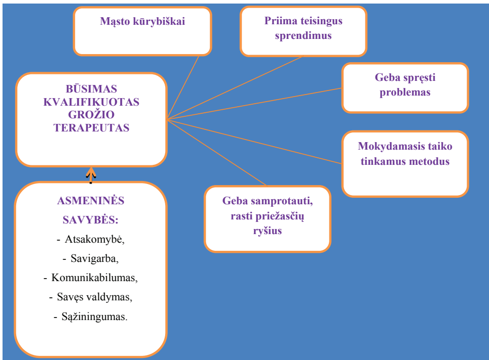
1 pav. Grožio terapeutui būtinos asmeninės savybės ir mąstymo įgūdžiai

S. E. Bidwell (2000) įsitikinimu, puikių rezultatų mokydamasis grožio terapeuto profesijos studentas gali pasiekti tobulindamas tam tikrus mąstymo įgūdžius (žr. 1 pav.).