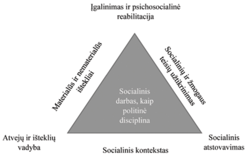
1 pav. Individualizuoto ir kontekstualizuoto socialinio darbo modeliai