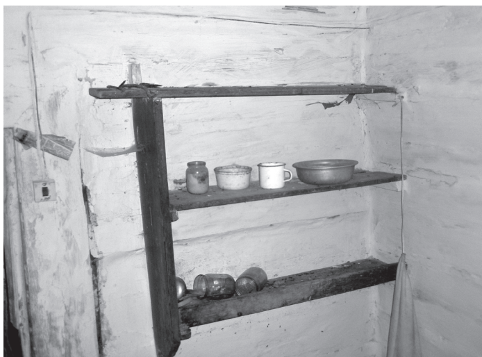
Фото 5. «Мысник» открытого типа в избе кон. XIX в.; с. Литвыця Дубровицкого р-на Ровенской обл.

мущественно навесные (более нового происхождения) (Сивак 2003, 149).