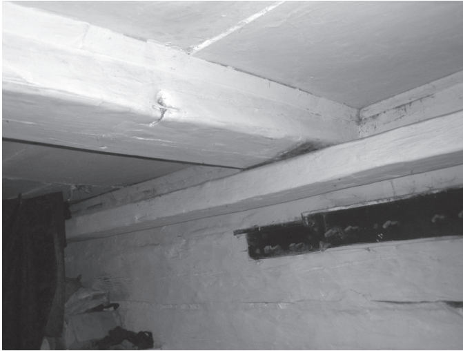
Фото 1. «Гряды», используемые в качестве полок в избе сред. XIX в.; с. Сэрэды Емильчанского р-на Житомирской обл.

хозяйственных клетях аналогичной конструкции. «Гряды», конструктивно связанные со срубом, характерны идля домов Карпатского региона (Кіщук 1983, 166), где их иногда оборудовали еще в избах начала XX в.