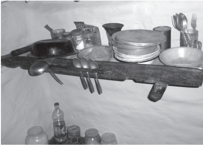
Фото 3. Полка в избе сред. XIX в.; с. Вэлыки Цэпцэвычи Володимирецкого р-на Ровенской обл.

подразумевал А. Киркор, описывая жилище надприпятских полещуков (Киркор 1882, 346). В тех случаях, когда потолок избы поддерживали комбинированные балки – «сволоки» (Киевская, Житомирская, Черниговская обл.), в качестве полки частично использовали и продольный «сволок» (между его верхней плоскостью и потолком оставалось свободное пространство, равное высоте поперечных балок).