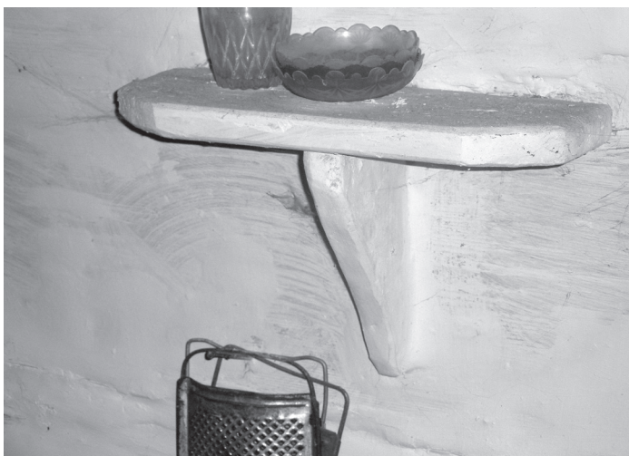
Фото 4. Полка в избе кон. XIX в.; с. Вэлыкэ Вэрбчэ Сарненского р-на Ровенской обл.

от длины полки) вбитые в стену колки («кулкы»). Колки, которые старались изготовлять из твердых пород древесины (Сивак 2003, 148), завершались своеобразными «головками», что предотвращало смещение доски. К внешнему краю полки часто крепили планку (дощечку пошире или поуже), которая предотвращала сдвиг положенных на полку вещей (с. Вэлыки Цэпцэвычи Володимирецкого р-на Ровенской обл.). На Полесье известен и другой (более архаический) конструктивный вариант оборудования такого бортика: его могли изготовлять одновременно с полкой из сплошного куска древесины (с. Радыжэвэ Володимирецкого р-на Ровенской обл.) (Свирида 1979, 58 (Рис. 9)). Иногда передний край полки-доски нечто поднимали, закрепляя колки в стену не горизонтально, а под определенным углом (Сивак 2003, 148). Полки покороче, размещенные при продольных стенах, могли опираться на колки (сс. Вэлыки Цэпцэвычи) или закрепляться к поперечным потолочным балкам (сс. Буки Малинского (Сивак 2003, 148), Запилля Лугинского р-нов Житомирской обл.), частично опираться на прикрепленный к стенам брусок (с. Злобычи Коростенского р-на Житомирской обл. (Сивак 2003, 148) и т. п.