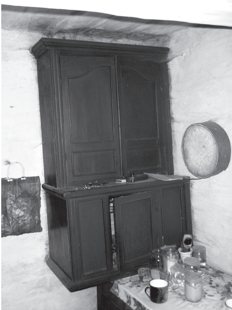
Фото 6. «Мысник» закрытого типа в избе кон. XIX в.; с. Крычильськ Сарненского р-на Ровенской обл.