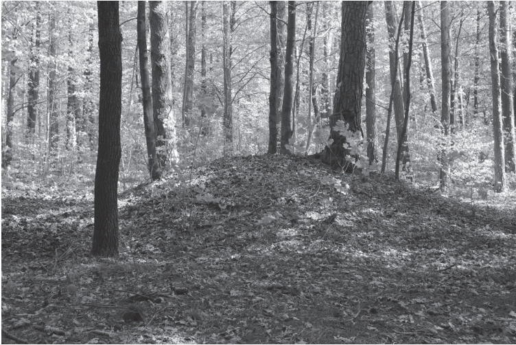
1 pav. Rusių Rago pilkapyno (Širvintų r.) pilkapis (2014).

Lietuvos valstybė XIII a. kūrėsi archeologinės Rytų Lietuvos pilkapių kultūros, pagrįstai siejamos su lietuvių gentimi, pagrindu. Lietuviai valstybės priešaušriu mirusiuosius laidojo sudegintus daugiausia iš smėlio supiltuose ir griovių apjuostuose pilkapiuose (1 pav.); atskiruose pilkapiuose buvo užkasami nedegintų arba sudegintų žirgų palaikai (Volkaitė-Kulikauskienė 1971, 10; LAA III 13; Juškaitis 2005). Skirtingų archeologų nuomonės, kada nustota laidoti pilkapiuose, varijuoja nuo XI a. pabaigos – XII a. pradžios (Kurila 2003, 31; 2009, 15) iki XII a. pabaigos – XIII a. pradžios (Tautavičius 1955, 96; Volkaitė-Kulikauskienė 1978, 15; Zabiela 1992, 20).