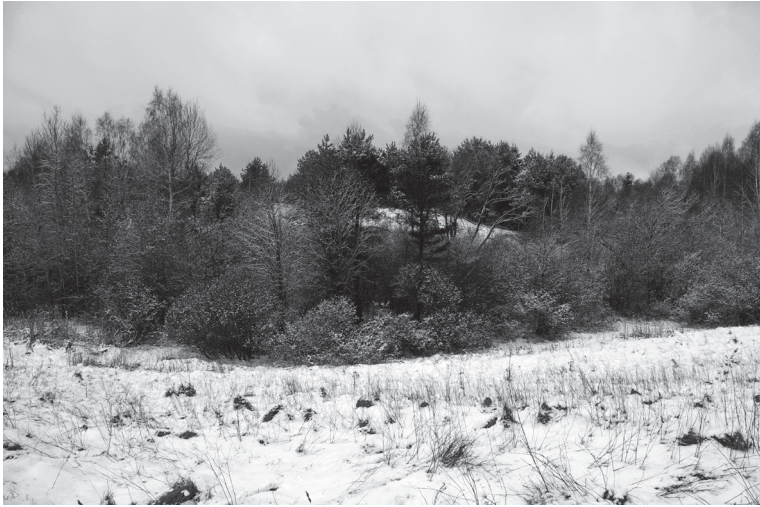
2 pav. Bedugnės kapinyno (Trakų r.) kalva (2014).

ginimo paprotys Lietuvoje buvo visuotinis ir vienodai paplitęs (Urbanavičius 1994, 3–4). Mirusiųjų deginimo papročio išsivyravimą, kaip vienos laidojimo tradicijos įvedimo rezultatą, mėginta sieti su XIII a. Šventaragio religine reforma (Vaitkevičienė, Vaitkevičius 2001; Vaitkevičius 2004). Kiti autoriai reiškė nuomonę, kad mirusiuosius nustota deginti dar iki oficialiai įvedant krikščionybę. Buvo teigiama, kad Rytų Lietuvoje jau XIII a. antroje pusėje, ypač nuo XIV a., pradėjo plisti nesudegintų mirusiųjų laidojimo būdas. Deginami tebūdavo tik aukščiausio valstybės sluoksnio asmenys, t. y. kunigaikščiai, įvairūs didikai ir kariai (Luchtanas, Vėlius 1996; 2002; Vėlius 1997–1998, 27, 45–47; 2001, 70–71; 2005, 16, 23–24).