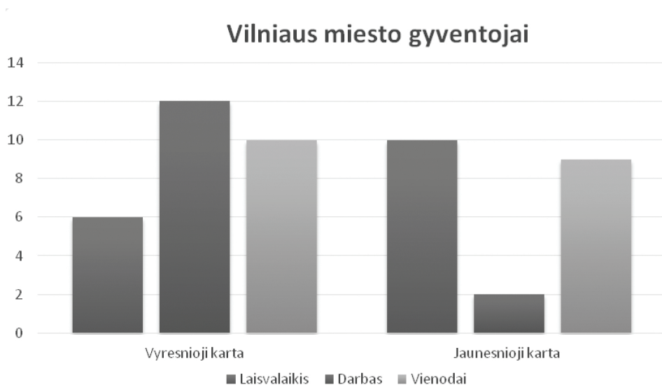
1 pav. Darbui ar laisvalaikiui skiriami prioritetai Vilniuje. N-49

togos, nes didelis užimtumas darbe apriboja laiką, kuris galėtų būti skiriamas atostogoms su šeima. Panašią situaciją matome ir Vilniuje (Paukštytė-Šaknienė 2019, 58).