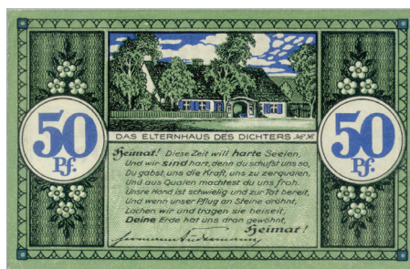
1 pav. Šilutės bendruomenės valdyba. 50 pfenigų. 1921 m. gegužės 28 d. laida. Dydis 70 x 110 mm

Trečioji ir ketvirtoji pinigų laidos turi tą pačią datą, bet dėl skirtingos išvaizdos ir spaustuvinių aišku, kad jos pasirodė ne vienu laiku. Apie trečiąją laidą duomenų spaudoje rasti nepavyko, o apie paskutinę rašyta daugiausia.