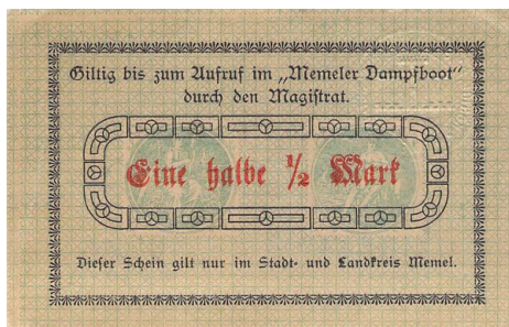
2 pav. Klaipėdos magistratas. \frac{1}{2} markės. Be pažymėtos datos (1918–1919 m. sandūra). Dydis 61 x 96 mm