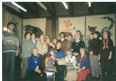
„Treji gaideliai giedoja“