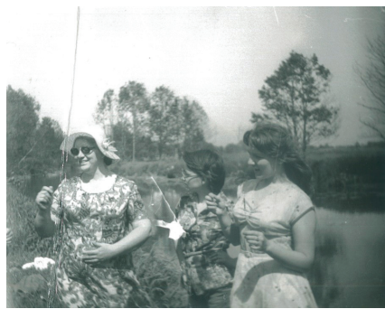
Išleistuvės prie Vorusnės