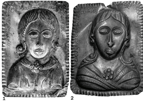
Fig. 2. Votive offerings made: 'For the aching head of the servant of God ...'. 1. Poltava Museum of Local Lore, ПКМБК 2848, М 58 (Власенко, Харченко 2020, с. 8). 2. Kyiv-Pechersk Lavra National Preserve 5

Some votive offerings in the collection of the Kyiv-Pechersk Lavra National Preserve were made by the same person. 4 The most similar examples are the votive offerings given 'for the aching head of the servant of God ...' (Fig. 2).