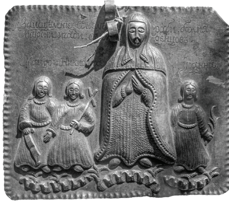
Figure 4. A votive offering made: ‘За исцѣленіе вѣхъ болѣзнь раби божія Матрони и чади ея младенцовъ Марию Никифора Иоанна’ 10

In general, most votive offerings were made for mass buyers, so they are serial in nature (only the signatures were engraved for a particular person), but some are individual artistic solutions, and may have been made to order (Власенко, Парасочка 2019, 433). Votive offerings with images of two or more people and their names (e.g. Fig. 4, and some other items from the Kyiv-Pechersk Lavra National Preserve 9 ) are examples of custom-made votive offerings.