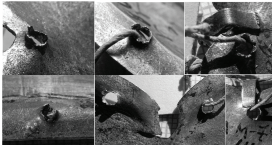
Fig. 1. Votive offerings with untidy holes 3

The holes for fixing votive offerings next to an icon or relics were probably sometimes (e.g. Fig. 1) made at the church, because they are made less carefully than is generally typical for a craftsman.