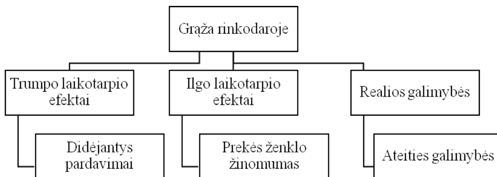
2 pav. Grąža rinkodaroje