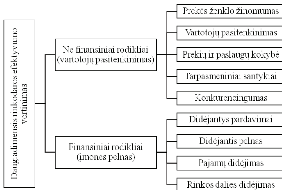
3 pav. Rinkodaros efektyvumo vertinimo rodikliai

Kaštų analizė. Įmonės kaštai, palyginus juos su konkurentų kaštais, yra svarbus strateginės padėties rodiklis. Kad įmonė sėkmingai konkuruotų, jos kaštai turi būti to paties lygio kaip ir varžovų. Norint kaštus palyginti su konkurentų kaštais, pasitelkiama veiklos kaštų grandinė, apimanti visas veiklos rūšis.