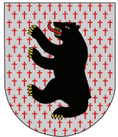
7 pav. Meškiučių herbas, patvirtintas 1999 m. Herbo etalono autorius – Saulius Bajorinas (Rimša, E. Lietuvos heraldika . Vilnius, 2008, p. 282)