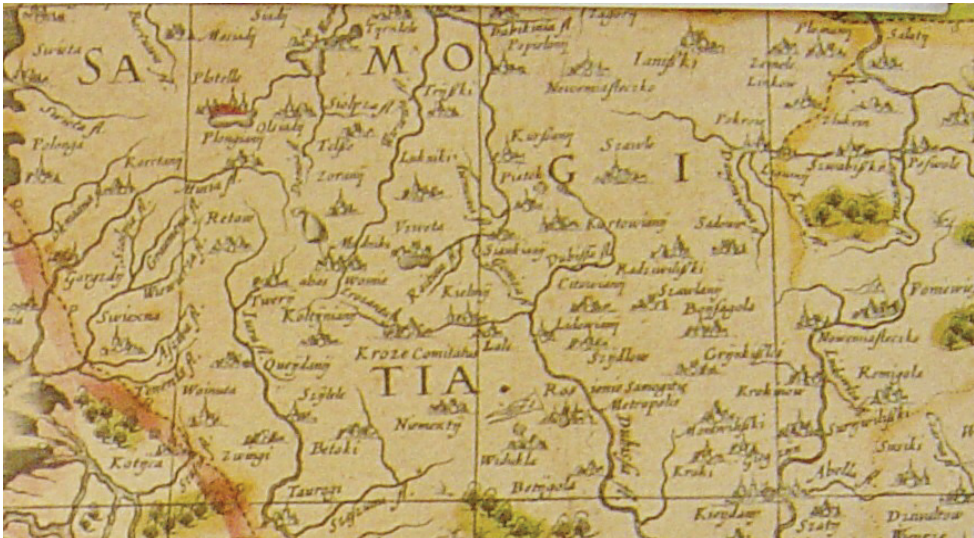
9 pav. RADZIVIL, Nicolai Christophor. [Lietuvos Didžiosios Kunigaikštystės žemėlapis], 1613. Šaltinis: SLŽ, nr. 10

Remiantis Radvilos LDK žemėlapiu, XVII–XVIII a. Vakarų Europoje buvo išleista labai daug žemėlapių, kurių visų čia neįmanoma paminėti ir aptarti. Istoriografijoje dažnai pabrėžiamas faktas, kad po M. K. Radvilos Našlaitėlio žemėlapio pasirodymo Vaka-