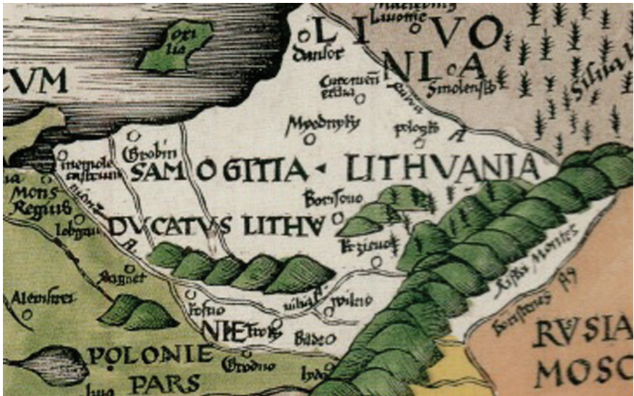
1 pav. UBELIN, George [CUSANUS, Nicolaus]. [Vidurio Europos žemėlapis], 1520.