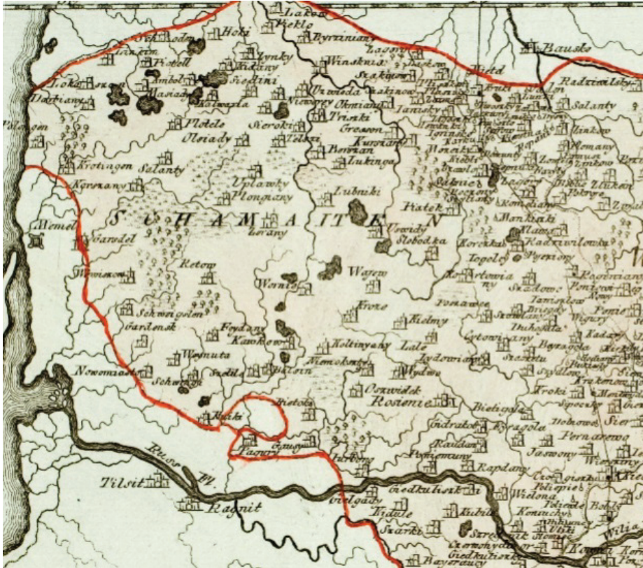
11 pav. REILLY, Franz Johann Joseph, von. [Lietuvos Didžiosios Kunigaikštystės šiaurės vakarų dalis, nr. 49], 1789.

XVII–XVIII a. žemėlapiuose jau nebuvo vartojama lotynizuota Žemaitijos vardo forma Samogitia 41 . Pagal tai, kurioje valstybėje buvo kuriamas žemėlapis, galima aptikti ir polonizuotą ( Zmvdzkie xiestwo ) 42 (10 pav.) bei germanizuotą ( Schamaiten ) 43 (11 pav.) Žemaitijos vardo formų. Be kita ko, XVIII a. labai dažnai buvo vartojamas Žemaitijos administracinį statusą valstybėje pažymintis žodis – kunigaikštystė ( Duche de Samogi-