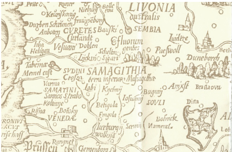
7 pav. VOPEL, Caspar. [Europos žemėlapis], 1566.