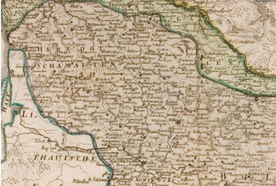
12 pav. SOTZMANN, Daniel Friedrich. [Lenkijos žemėlapis], 1796.

tie, Herzogt Schamaiten, Samogitia ducatus ir pan.) 44 (12 pav.). Nors korektiška Žemaitiją vadinti seniūnija, tačiau jos įvardijimas seniūnija ( Starostia o Samogitia ) 45 (13 pav.) šio laikotarpio žemėlapiuose yra sąlyginai retesnis nei kunigaikštyste . Būta atvejų, kai kartografas sinonimiškai vartojo seniūnijos ir kunigaikštystės nominacijas ( Starostia o Ducato di Samogizia ) 46 . Tačiau galima rasti ir klaidingų nominacijų, kai Žemaitija buvo įvardyta vaivadija ( Palat di Smundz ) 47 (14 pav.). Peržiūrėjus nemažai čia minimo laikotarpio žemėlapių, galima išskirti juose užfiksuotas šias Žemaitijos vardo formas: Samogitia , Samogitie , Samogite , Samogithia , Samogetia , Samogizia , Samogisia , Schamaiten , Samauin , Theil von Samogitien , Samogitiae pars , Samogitia Pars , Duche de Samogitie , Starostia o Samogitia , Starostie de Samogitie , Starostia o Ducato di Samogizia , Herzogt Schamaiten , Palat di Smundz , Samogitia Samodzka zemla , Samogitia ducatus , Samogitiae ducat , Zmvdzkie xiestwo , Dvcato di Samogioita , Samogitie des estats de Lithuanie .