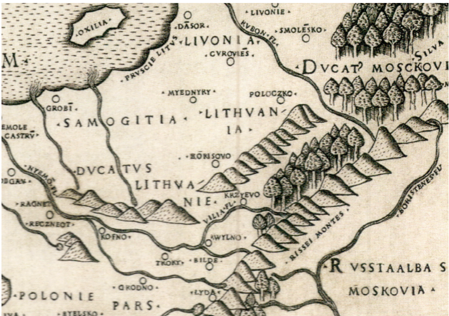
2 pav. BENEVENTANUS, Marcus. [Lenkijos, Vengrijos, Bohemijos, Vokietijos, Rusijos ir Lietuvos žemėlapis], 1507.