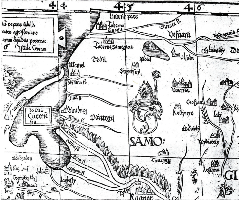
4 pav. WAPOWSKI, Bernard. [Lenkijos žemėlapis], 1526.