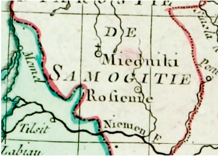
12 pav. TOUR, Louis Brion. Lenkijos ir Lietuvos valstybės žemėlapis, 1766.

Lenkijai ir Lietuvai skirtus žemėlapius, pavyzdžiui, Louiso Briono (M.) de la Touro 44 (12 pav.), Antonio Zatta'os 45 (13 pav.) ar Rigoberto Bonne 46 (14 pav.). Šie kartografai rinkosi vaizduoti santykinai nedaug duomenų, taigi Tauragės net nežymėjo. Tačiau sienos linijos kontūras neleidžia abejoti, kad informacija apie Prūsijos karalystės valdymą Tauragėje jiems tikrai buvo žinoma.