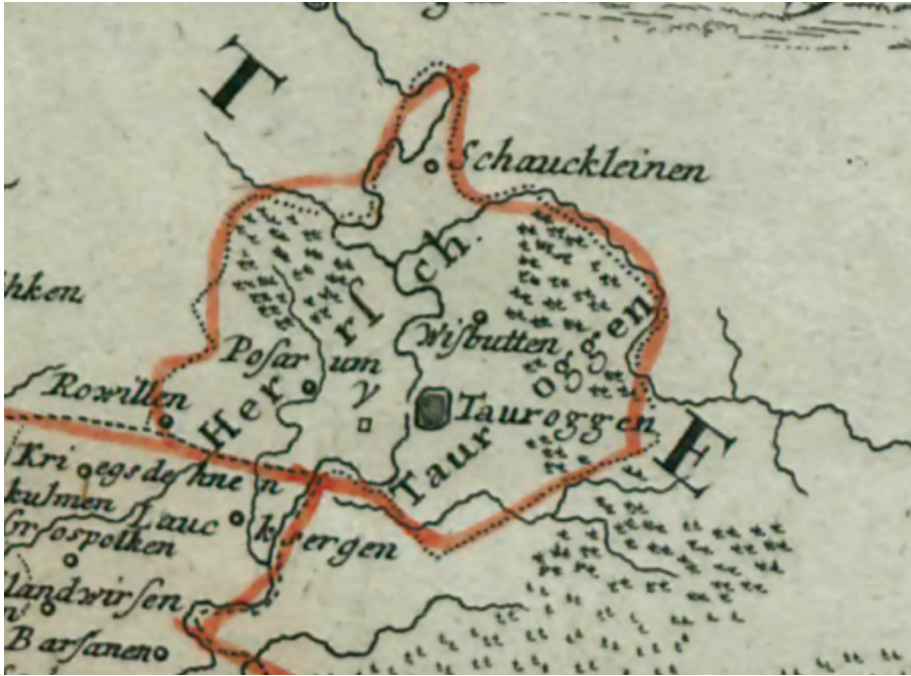
15 pav. GÜSSEFELD, Franz Ludwig. Prūsijos karalystės žemėlapis, 1775.

dešimtmečiu anksčiau išleistame Jano Władysława (Johann Wladislaus) Suchodoletzo žemėlapyje taip pat regime panašų vaizdą 48 (16 pav.). Be jau minėtų objektų, šis kartografas dar pažymėjo nebeegzistuojantį Šležų ( Slesen ) kaimą ir Tauragės palivarką ( Vorwerk ).