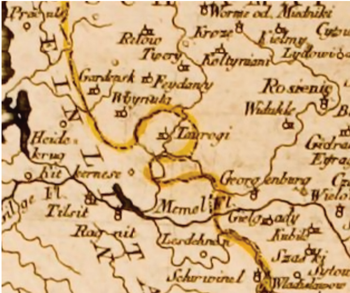
8 pav. HUTTER, Franz Xaver. Lenkijos karalystės žemėlapis, 1793.

autorystei priklauso projekto „Penkių pasaulio dalių vietovės“ 39 įgyvendinimas, sukūrė daugiau nei 800 žemėlapių. Lenkijai ir Lietuvai skirtame žemėlapyje Nr. 38 ir Nr. 49 taip pat regime sprendimą brėžti Tauragės valdos ribas liudijant jos priklausomybę Prūsijai 40 (9 pav.).