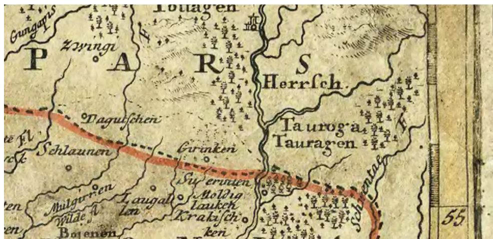
5 pav. HOMANN, Johann Baptist. Prūsijos karalystės žemėlapis, 1760. Šaltinis: https://rcin.org.pl