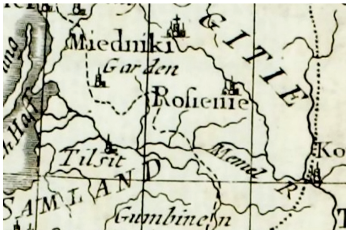
14 pav. BONNE, Rigoberto. Lenkijos karalystės ir Lietuvos Didžiosios Kunigaikštystės žemėlapis, 1789.