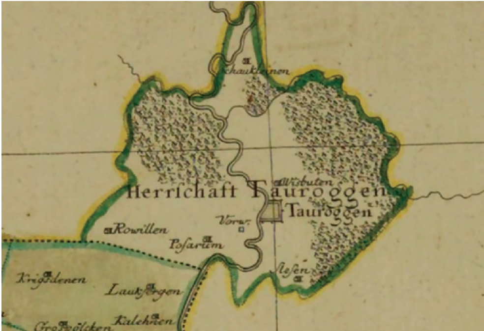
16 pav. SUCHODOLETZ, Jan Władysław. Prūsijos karalystės žemėlapis, 1763.

Požerūnai ( Poszeruhnen ), Maščiai ( Matschen Holl. ), Ližiai ( Holl. Lisse ), Šležai ( Slesen ), Skirgailai ( Krongay ), Baltramiejiškiai ( Baltromeuten ), Kraštinė? ( Socianer ).