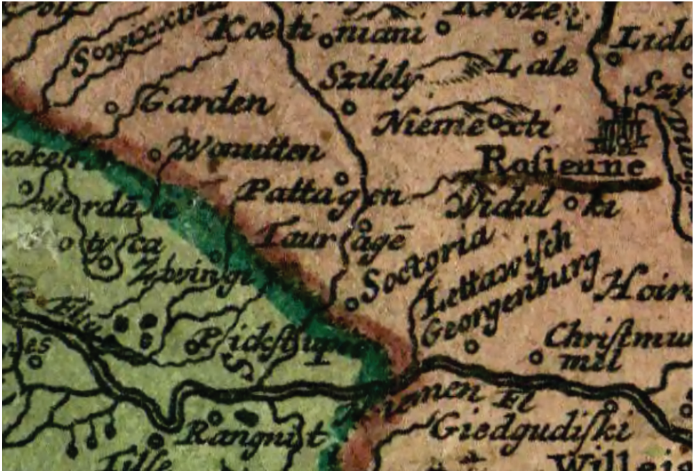
3 pav. HOMANN, Johann Baptist. Lenkijos karalystės ir Lietuvos Didžiosios Kunigaikštystės žemėlapis, 1715.

Pažymėtina, kad galimai vienas pirmųjų Prūsijos karalystei skirtų žemėlapių, kuriame Tauragės pavaldomo pokyčiai jau atsiskleidžia, pasirodė 1701 m. Jį išleido minėtasis J. B. Homannas. Savo žemėlapyje jis pažymėjo pačią Tauragę ( Tauroga ) ir Tauragės valdą ( Tauragen ), tiesa, nebrėždamas jokių valdos perimetrą liudijančių ribų 35 (4 pav.). Kitose šio autoriaus žemėlapio laidose (5 pav.) ir kitų kartografo žemėlapuose (6 pav.) laikomasi tos pačios vaizdavimo praktikos, tačiau kartais pridamas užrašas „Herrsch[aft]“, aiškiai liudijantis, jog tai yra „Tauragės valda“ 36 .