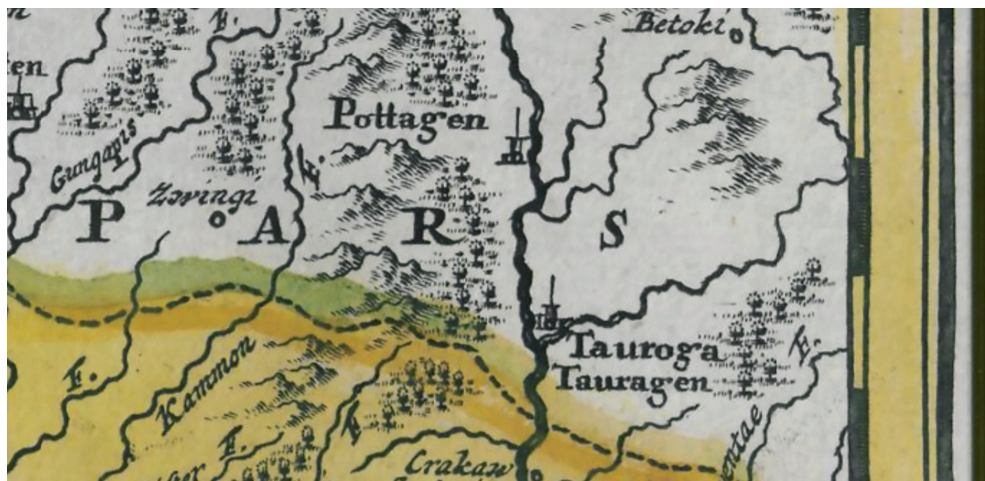
4 pav. HOMANN, Johann Baptist. Prūsijos karalystės žemėlapis, 1701.