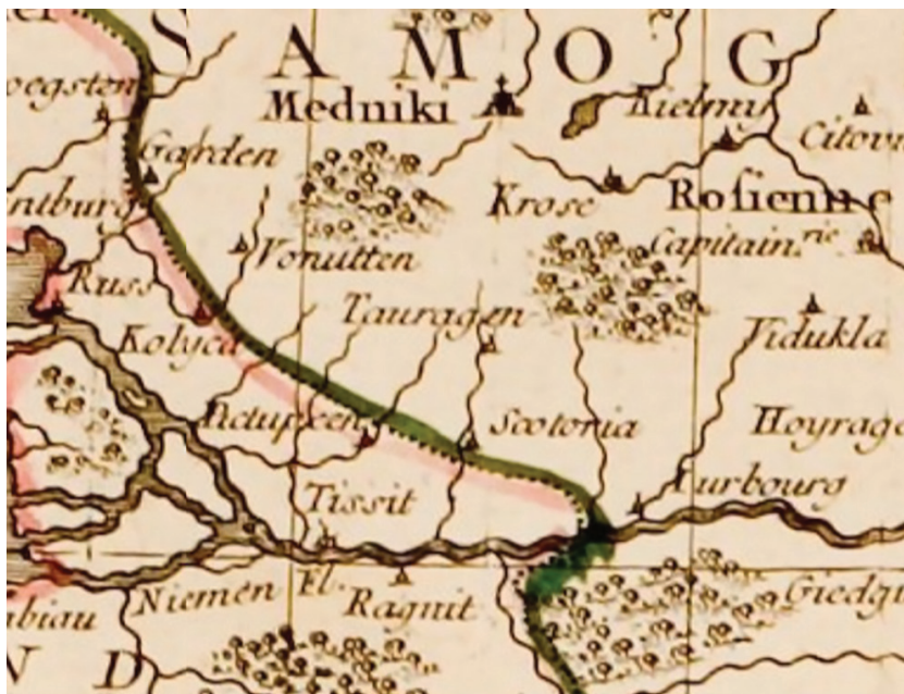
2 pav. JANVIER, Jean. Lenkijos ir Prūsijos karalystės su Kuršo hercogyste žemėlapis, 1760.