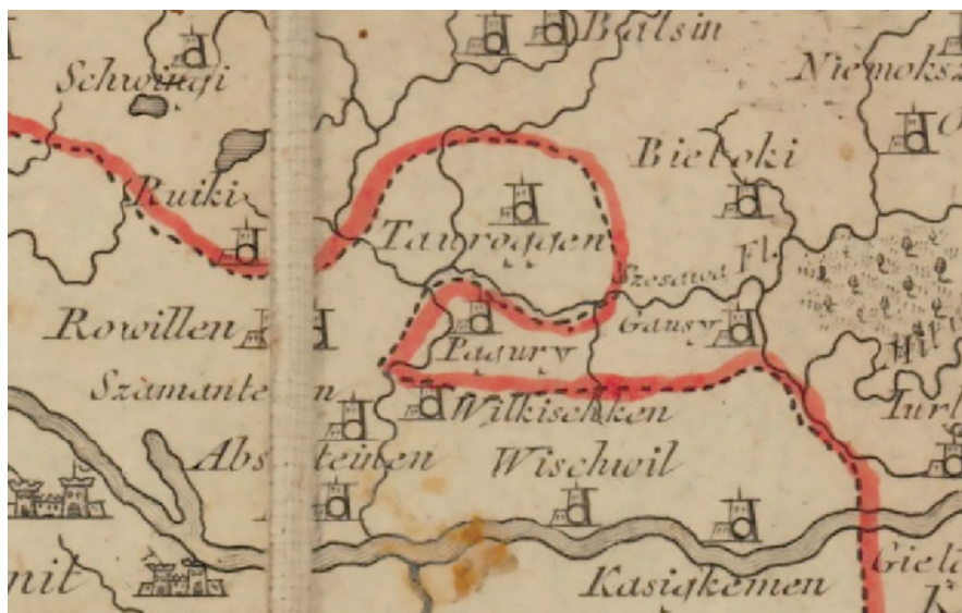
11 pav. RIZZI-ZANNONI, Giovanni Antonio, SCHRAEMBL, Franz Anton, UZ, Georg Friedrich. Bendras Lenkijos, Lietuvos ir gretimų šalių žemėlapis, 1793.