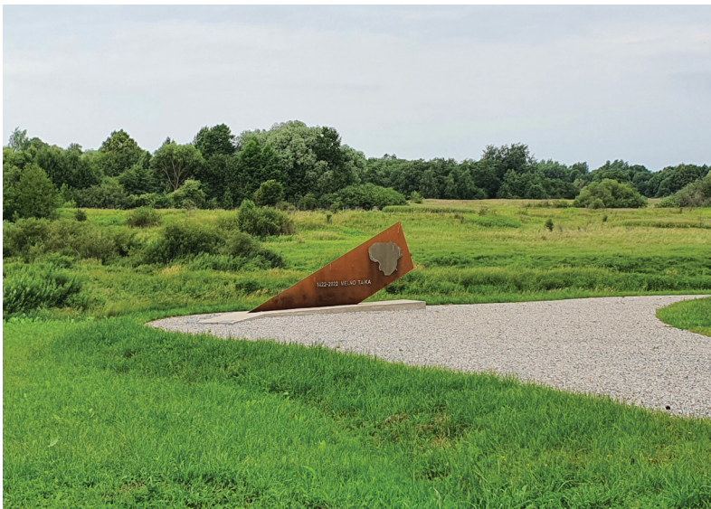
8 pav. Melno taikos 600-mečiui skirtas atminimo ženklas (archit. Mantas Paketuris, gamino Andrius Vencius) Kudirkos Naumiestyje. 2023 m.