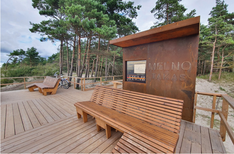
7 pav. Informacija apie Melno sutartį poilsiautojams skirtame pasivaikščiavimo take, kurį Palangos savivaldybė Baltijos jūros pakrantėje įrengė 2025 m.