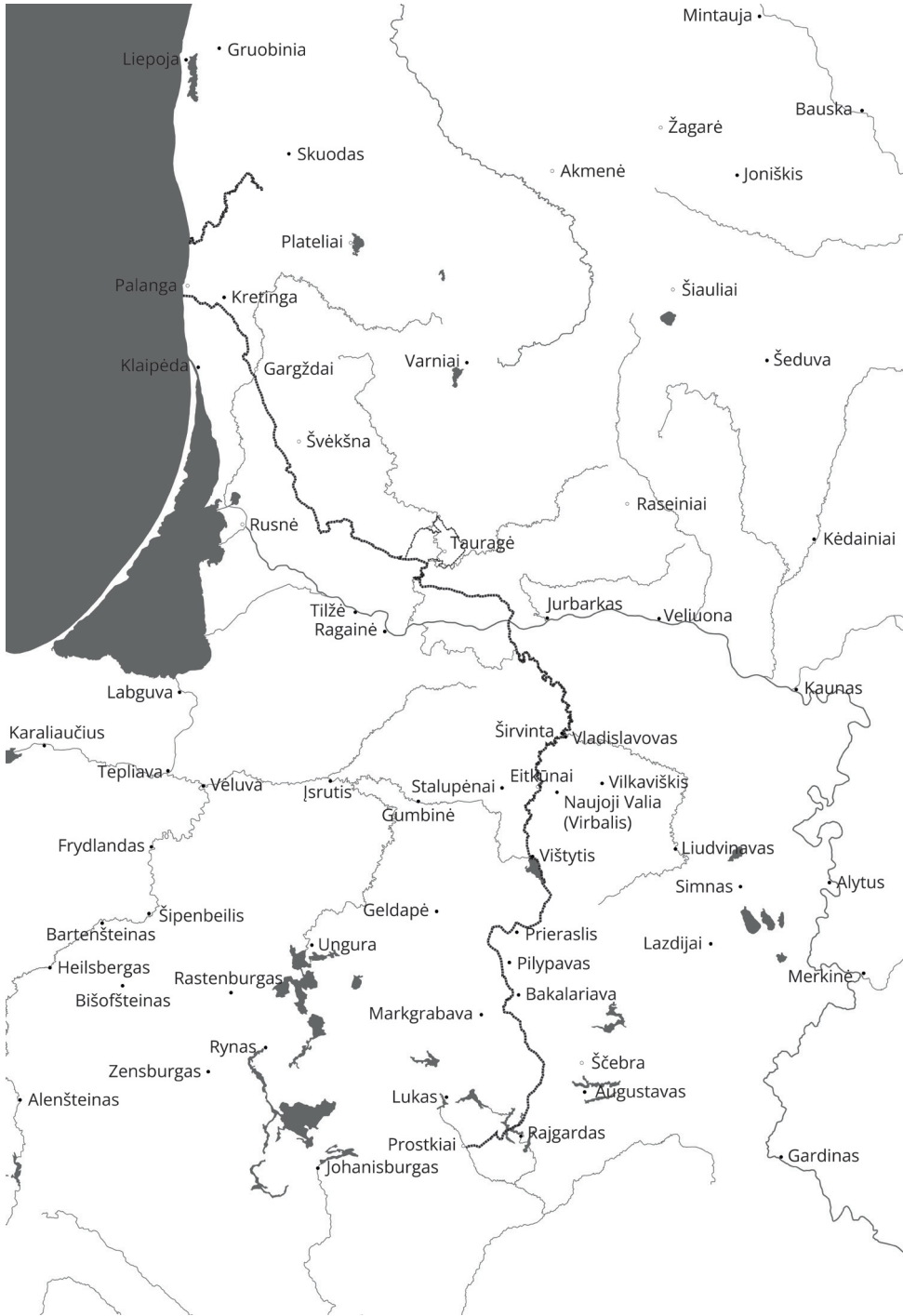
1 pav. Schema vaizduoja du Lietuvos ir Vokiečių ordino valdų Prūsijoje bei Livonijoje sienos ruožus. Šios sienos kontūras schemiškai apibrėžtas Melno sutartimi. Taip pat schemoje pavaizduota dalis įvardiniame straipsnyje minimų vietovių. © Vasilijus Safronovas, 2025