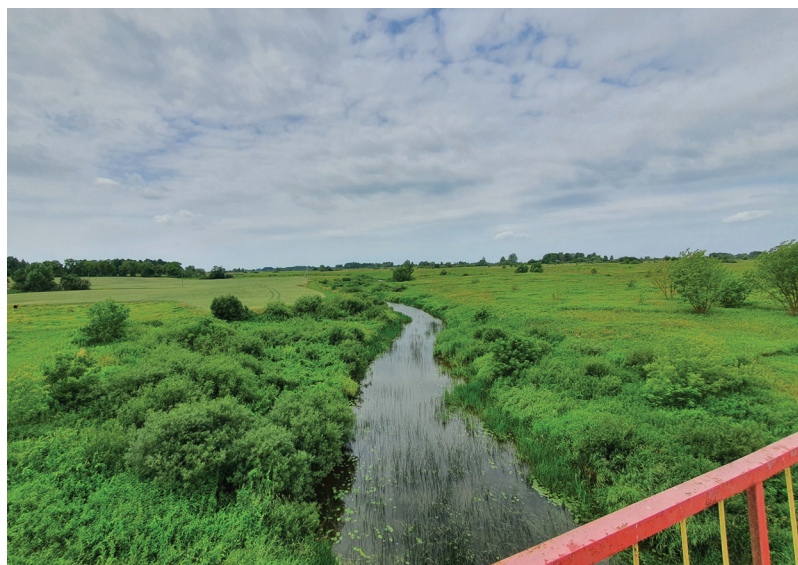
6 pav. Širvintos upelis – natūrali riba, 1422 m. nustatyta tarp Lietuvos ir Prūsijos, šiandien tebeskiria Lietuvą ir Europos Sąjungą nuo Rusijos. Vaizdas nuo tilto Kudirkos Naumiestyje. 2023 m.