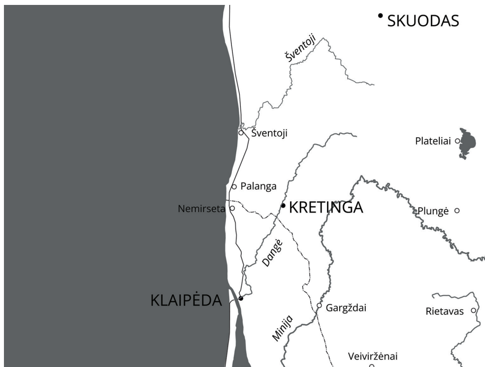
2 pav. Palangos sąveikos mazgo schema. Juodi taškai žymi miestus, apskritimai žymi kitas svarbias gyvenvietes (miestelius, kaimus). Punktyrinė linija žymi Lietuvos ir Prūsijos sienos kontūrą, ištisinė linija – senojo magistralinio kelio liniją XVIII amžiuje. © Vasilijus Safronovas, 2025

hercogo valdos, mat Gruobinio valda, kaip minėta, 1560–1609/1610 m. priklausė Prūsijai, tik vėliau atiteko Kuršui; greta – Piltenės (vok. Pilten ) valda, kuri kurį laiką (1559–1583 m.) priklausė Danijai, o 1585–1609 m. taip pat Prūsijai, paskui Abiejų Tautų Respublikai, nuo 1656–1657 m. – Kuršui, tačiau 1717 m. vėl grįžo į Respublikos sudėtį. Kitaip tariant, neilgame vos 20 km pajūrio ruože magistralinis kelias kirto ne tik tris gyvenvietes, bet ir dvi sienas, kurių skirtingose pusėse XVI–XVIII a. pynėsi virtinė interesų ir pavaldumų 71 . Svarbaus sąveikos mazgo funkciją šis ruožas dar kurį laiką išlaikė ir po 1795 m., kai Rusijos imperija per Abiejų Tautų Respublikos padalijimą prisijungė ir Kuršą, ir Lietuvą.