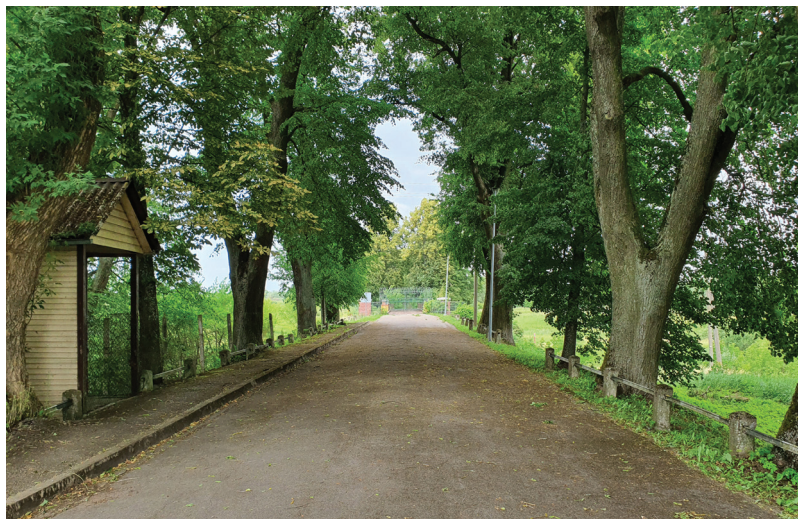
5 pav. Senasis kelias per sieną, kadaise jungęs Kudirkos Naumiestį (Vladislavovą) ir Širvintą. 2023 m.