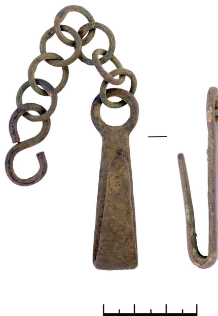
4 pav. Partizano uniformos detalė: diržo kabutis-laikiklis su grandinėle.