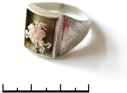
2 pav. Sidabro lydinio žiedas su Vyčiu.

Iš viso žvalgant Užpelkių miško kautynių vietą buvo aptiktas 221 radinys 50 . Didžiąją jų dalį sudaro šaudmenys: dešimt rusiškų ir du vokiški neiššauti šoviniai, 140 rusiškų ir dvi vokiškos šovinių tūtelės, 38 rusiškų šovinių kulkos. Iš rusiškų šaudmenų minėtini: šeši 7,62×25 mm ir keturi 7,62×54R mm kalibro šoviniai, 78 pistoleto-kulkosvaidžio PPŠ ir 61 7,62×54R mm kalibro kulkosvaidžio, karabino „Mosin“ ir pusiau automatinio šautuvo SVT šovinio tūtelė. Dar viena partizanų stovyklavietėje rasta tūtelė nuo nešauto 7,62×25 mm kalibro šovinio – jo kulka nulaužta, parakas, spėjama, išbertas įkuriant laužą. Rusiškų šaudmenų grupei taip pat skiriama: 20 7,62×54R mm kalibro, 16 pistoleto-kulkosvaidžio PPŠ ir 2 suplotos neaiškių šovinių kulkos. Ant dalies pistoleto-kulkosvaidžio PPŠ šovinių ir tūelių įmuštos 1940, 1944 ir 1945 m. datos, ant 7,62×54R mm kalibro šovinių ar jų tūelių – 1939 ir 1940 m. gaminimo datos.