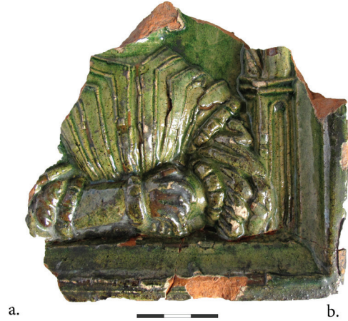
6 pav. a) Heinricho Aldegreverio graviūra (1536), vaizduojanti anabaptistą Bernhardą Knipperdollingą. b) Graviūros pagrindu kurtas plokštinis koklis, būdingas XVI a. viduriui ir antrajai pusei (Didžioji Vandens g. 14A, 1988, MLIM, L. nr. 30, inv. nr. 23544; MLIM, AS 38).

žinta ir nepublikuota. Tokio pobūdžio koklių retumas patvirtina, kad Reformacijos paliestuose kraštuose koklių puošyboje labiausiai paplito liuteronų ir kalvinistų portretai. Radikalioji Reformacija tokiu reiškiniu, kuris plačiai atsiskleistų koklių puošyboje, netapo. Tad kaip vertinti aptartuosius pavydžius? Miunsterio mieste visai arti minėtos anabaptistų lyderių egzekucijos vietos rasti XVI a. antrosios pusės kokliai su Jano iš Leidenos portretu tyrinėtojų buvo prilyginti sensacijai ir tiesiogiai susieti su anabaptistų maišto atgarsiais 58 . Paderborno mieste aptiktas koklis aiškintas ne taip tiesmukai – anot jį tyrusios mokslininkės, neaišku, kiek jis susijęs su anabaptistų idėjų atgarsiu tiesiogiai, o kiek su krosnies savininko nusiteikimu prieš Katalikų bažnyčią 59 . Toks samprotavimas gana aptakus ir susieja artefaktą su protestantizmu bet kokiu atveju, tačiau mažai paaiškina skirtingų tikėjimo išpažinėjų tarpusavio ideologines priešpriešas. Juk anabaptistus, radikaliąją Reformacijos atmainą, smerkė tiek katalikai, tiek ir liuteronai bei reformatai. Bet ar nestebina ypač mažas anabaptistus perteikiančių koklių paplitimas Europoje, gal liudijantis tik ribotą jų naudotojų, t. y. radikaliųjų pažiūrų šalininkų, auditoriją?