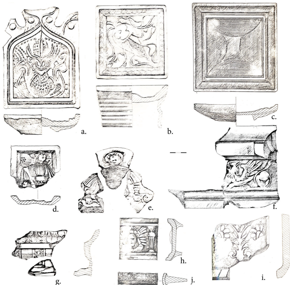
2 pav. Krosnietėje rastų koklių pavyzdžiai, būdingi: a–c) XV a. pabaigai – XVI a. pirmajai pusei; d–g) XVI a. viduriui ir antrajai pusei; h–j) XVII a. viduriui; i) XVII a. pabaigai. Šaltinis: ŽULKUS, V. Gyvenamasis namas..., pieš. 1:1, 2:1–2; 3:2; 4:1–2; 7; 8:1,2,4 (autorė L. Paulaitė); MLIM , AS 38

koklis ir dar du šio tipo fragmentai 34 , kuriuos tiksliau datuoti dėl laikotarpio, kuriuo jie buvo paplitę, ilgumo sudėtinga.