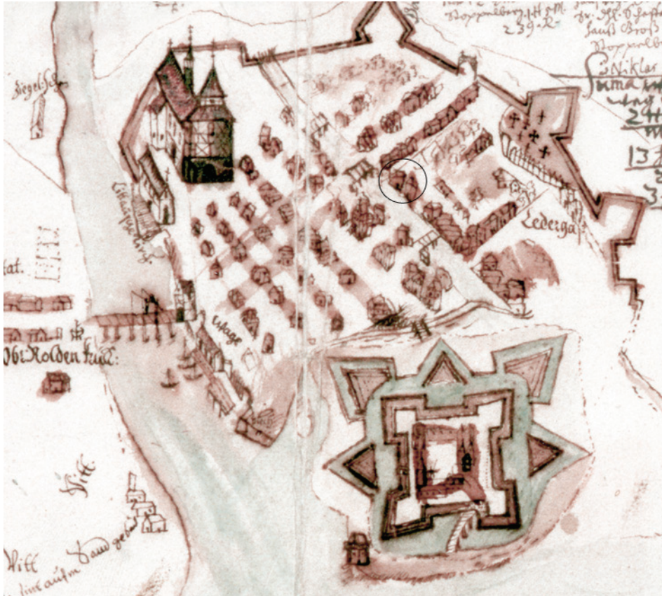
9 pav. Namo su krosnimi (dab. Didžioji Vandens g. 14A) vieta Klaipėdos valsčiaus žemėlapyje, apie 1650 m. Žemėlapio fragmentas. Šaltinis: MLIM . Originalo saugotojas: Staatsbibliothek zu Berlin – Preußischer Kulturbesitz, Kartenabteilung, Sign.: S Kart N 11999/50

koklių radavietės, lokalizuojamos miesto teritorijoje ar piliavietėje 90 . Taigi, atsižvelgiant į to, kas pavaizduota ankstyvuosiuose kokliuose, datavimą, gotikiniai aptariamoms krosnies kokliai galėjo būti jau tretinio naudojimo medžiaga.